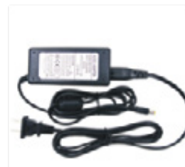
Fonte de alimentação