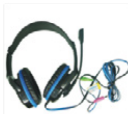
Fone e microfone