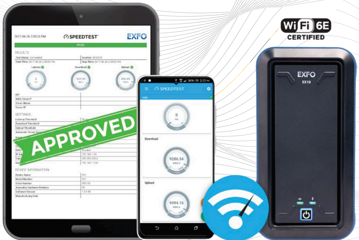
Teste de WiFi